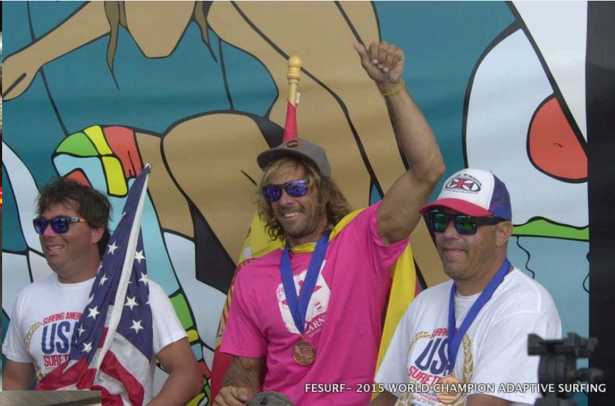
FESURF- 2015 WORLD CHAMPION ADAPTIVE SURFING